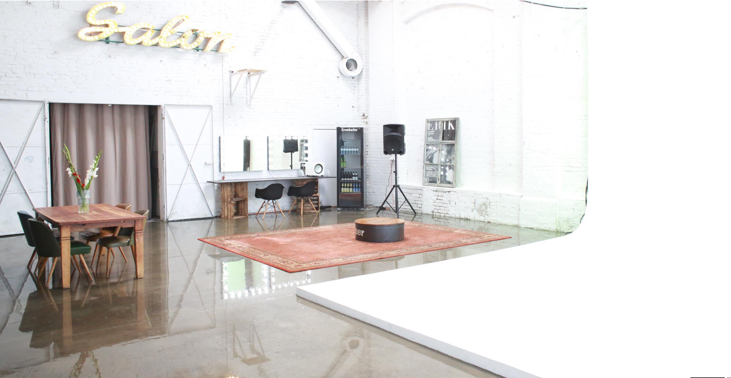
Studio Ansicht 1